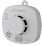
無線連動式親器 (煙式)