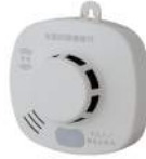
無線連動式子器 (煙式)